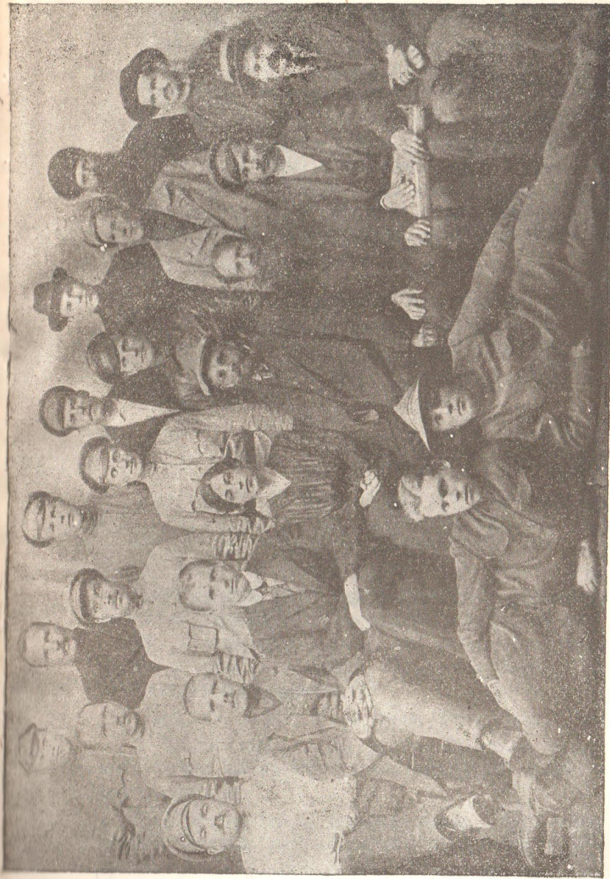
Шенкурский Уездный Исполком (1918 г.).