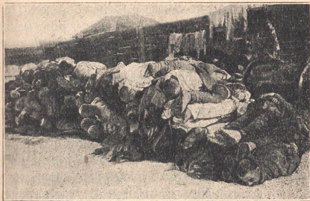
Группы рабочих поселка Куломзино, расстрелянных колчаковцами в феврале 1919 года.

Переход верховного командования армией к Колчаку совершился быстро и без особых потрясений. Фактическая власть в эсеровской армии все равно принадлежала старому офицерству и генералам, которые в большинстве принимали участие в подготовке колчаковского переворота. После пере-