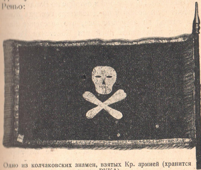
Одно из колчаковских знамен, взятых Кр. армией (хранится в музее РККА).

А вот выдержка из обращения того же периода французского «высокого комиссара» в Сибири Реньо: