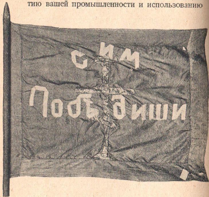
Одно из колчаковских знамен, взятых Кр. армией (хранится в музее РККА).

«Нашей задачей является содействие развитию вашей промышленности и использованию