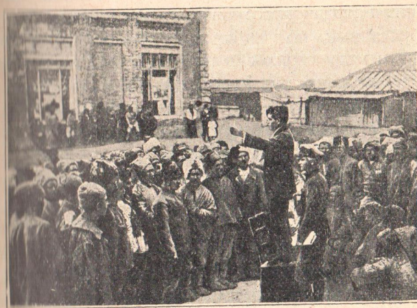
Митинг колчаковских перебежчиков мусульман.

три Сибири. Восстания сибирских крестьян и их вооруженная борьба с белогвардейщиной—одна из самых ярких страниц нашей гражданской войны. Сибирские партизаны оказали громадные услуги Красной армии, оттягивая на себя значительные силы колчаковских войск и внося смятение в тылы