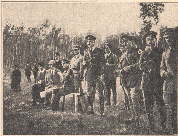
Колчак с офицерами английской военной миссии (близ Омска—лето 1919 г.); за Колчаком стоит ген. Нокс. (Из материалов музея РККА).

Кроме Англии Колчаку посылали военное снаряжение и другие державы. Мы пока не имеем общей сводки помощи, оказанной Колчаку прочими державами Антанты. Но в белогвардейских документах того времени часто попадаются упоминания о