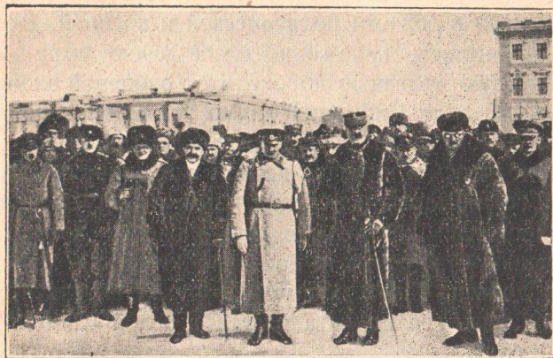
Колчак (в шинели) и ген. Жаннен (слева от Колчака) на параде в Омске в феврале 1919 года.

Кроме того генерал Нокс будет иметь задачей содействовать в тыловом районе организации и обучению формируемых частей войск. Английские