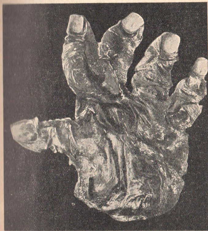
Перчатка из человеческой кожи, содранная колчаковскими (дуртовскими) офицерами с руки живого пленного красноармейца на станции «Сахарная» Уральской области в 1919 году. (Хранится в музее РККА.)

Колчака постигла участь всех русских контрреволюционеров, боровшихся против советской власти. У контрреволюции не было самого главного — массы, солдат, которые добровольно пошли бы на защиту интересов буржуазии, помещиков и ге-