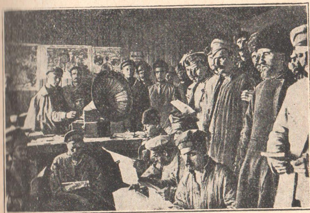
Раздача литературы уральским казакам, перешедшим в Красную армию.

и кулачества. Были даже специальные «полки Инсуса», в которых принимало участие духовенство. Победы над ними стоили Красной армии не дешево. Но главная масса колчаковских войск все-таки состояла из мобилизованных трудящихся, симпатии которых были на стороне Советской Рос-